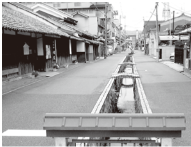
写真上：折り紙金魚の屏風／下：紺屋川